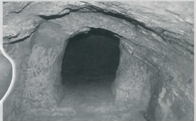
玄室の入口 (土手内横穴墓)