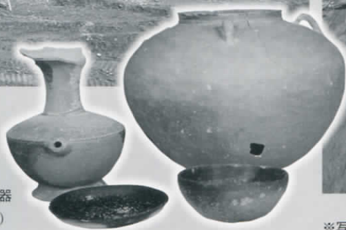
副えられた土器 (土手内横穴墓)