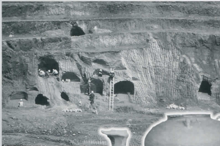
群をなす横穴墓 (茂ヶ崎横穴墓)

仙台市内の身近な遺跡を紹介するシリーズの2回目です。仙台市と名取市のあいだを流れる名取川付近には数多くの遺跡がみられます。その中で名取川や広瀬川ぞいの平地を見下ろす丘陵斜面には、古墳時代終末期から奈良時代にかけて数多くの横穴墓が造られており、東北地方でも有数の分布域となっています。今回はこの横穴墓を取り上げ、これまでの発掘調査により明らかになってきた横穴墓の構造、埋葬や副葬などの特徴、そして被葬者について出土資料や模型とともに紹介します。